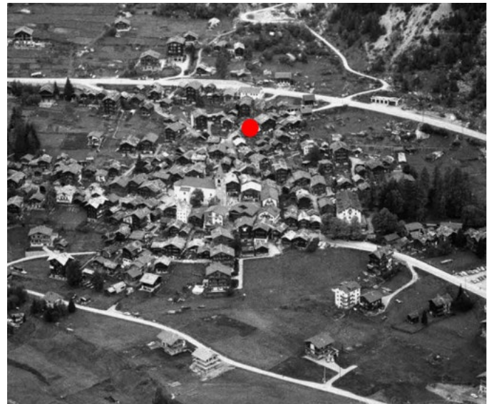
Vue du village d'Evolène.

Le nom « Evolène » vient du patois « Ewelina », signifiant « là où l'eau est facile ». La commune d'Evolène est composée de six villages : Evolène, Arolla, Les Haudères, La Sage, La Forclaz et Villa, ainsi que de nombreux hameaux. La commune occupe 21000 ha, ce qui en fait la 12 ème plus grande de Suisse, malgré son faible taux d'habitants. Elle se situe aux pieds de la Dent Blanche, et en surplomb de la rivière de la Borgne. La région est soumise aux risques d'avalanches, aux dangers de crues de la Borgne et au risque de chute de pierres. Le centre de la commune est le village d'Evolène, construit sur une plate-forme rocheuse. Les habitations sont concentrées là où les dangers naturels présentent le moins de risque. La commune a vécu en autarcie jusqu'au XIX ème siècle. Seule une route menait à la vallée, jusqu'à la construction de la route de contournement au nord-est du village après la Seconde Guerre Mondiale.